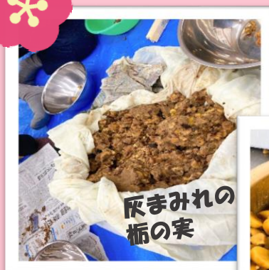
灰まみれの 榎の実