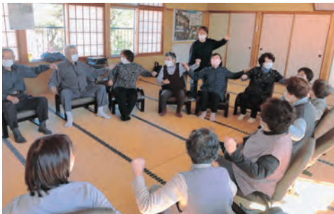
【地域の茶の間事業】

地域の公会堂や集会所を拠点に、体操や趣味活動等、各々で楽しめる内容を企画し取り組まれています。